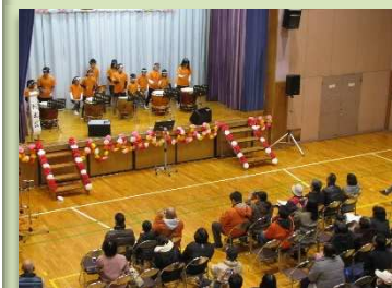
大正小 和太鼓演奏